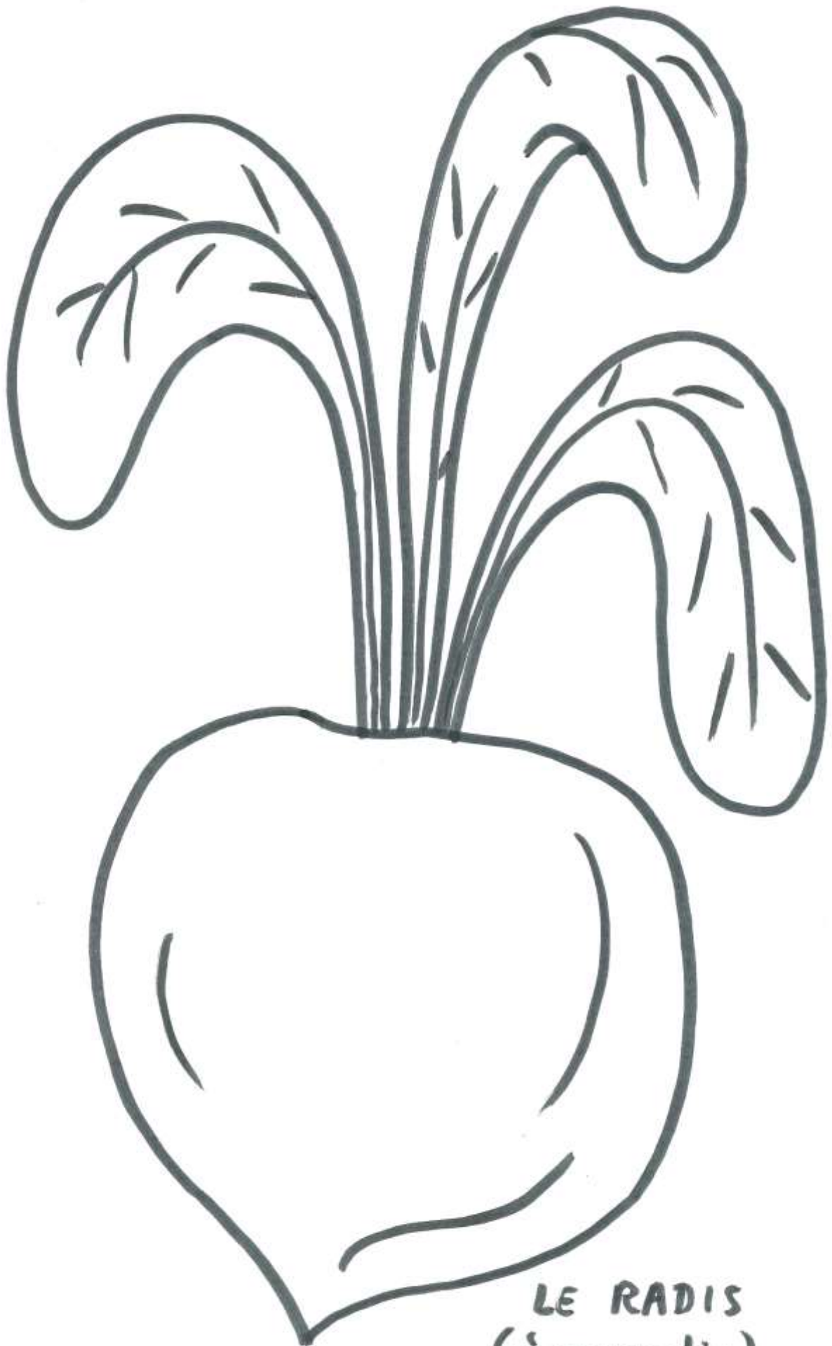
LE RADIS (à agrandir)